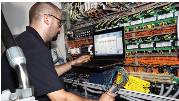
Obr. 1 Použití programu PCSCHEMATIC Service v praxi